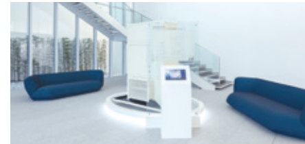
01 工場生産型初号機

体感ルームや様々な仕掛けによって、普段は目にすることのできない空気の魅力を可視化しています。