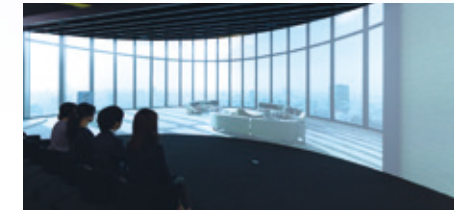
04 Welcome Theater

オフィススペースでは、デスク上に個別の吹出口を設け、暑がりな人も寒がりな人も自分好みの空気環境を作り出せるパーソナル空調方式を採用しています。