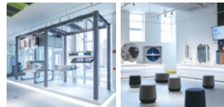
06 製品・部品ゾーン

天井昇降式の体感ルームでは、様々な空気質を実際に体験することができます。また空調機内の空気の状態を空気線図で示し、可視化しています。