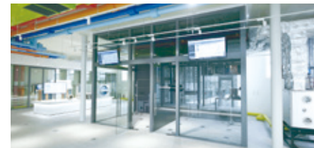
05 Air Experience

高さ3m×幅11mのラウンド型巨大スクリーンでは、映像視聴はもちろん、ウェブカメラを使用したリモート工場検収が可能です。