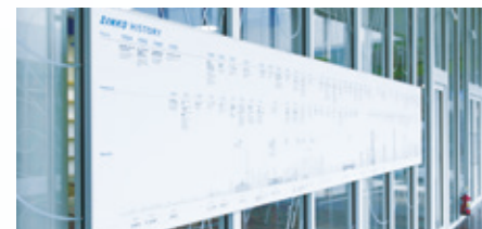
10 SINKO History

対話を通じた様々なコラボレーションを生み出す「共創の場」。空調に関する講演会や、イベントなどを開催します。設置された3面マルチウォールでは、納入実績をご覧いただけます。