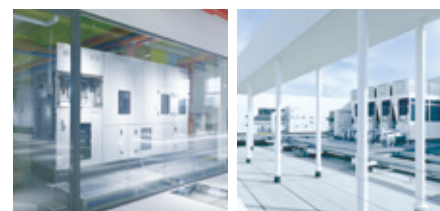
11 稼働製品ゾーン(室内・屋外)

エアスタ内には、各フロアに使用されている空調機及び熱源機器等が設置されており、実際の大きさや運転状況などをご覧になれます。