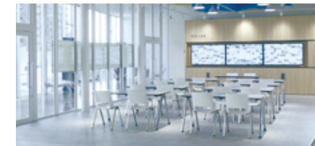
09 Air Lab.

異常検知システム搭載空調機の運転状態をクラウド経由でモニタリング。稼働中空調機の各部状態をリアルタイムでご覧いただけます。