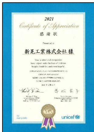
日本ユニセフ協会 感謝状