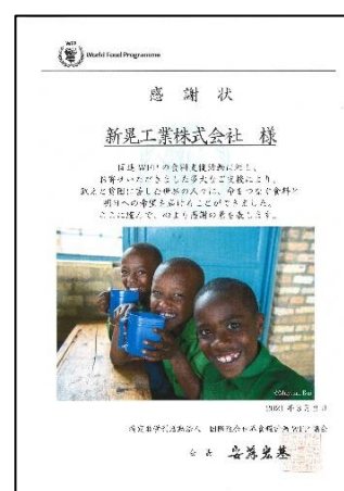
国連 WFP 協会 感謝状