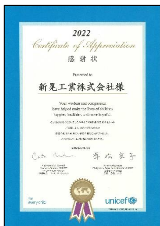
日本ユニセフ協会 感謝状