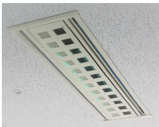
△UVC ランプを搭載したファンコイルユニット